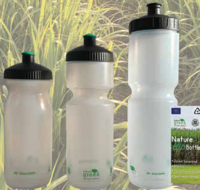
600ml BM 750ml BM 1000ml MAX