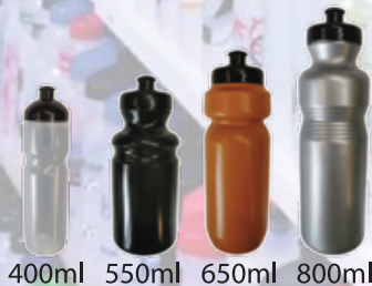
400ml 550ml 650ml 800ml

Sie können ganz bequem in unserem Bottlebuilder Ihre Flasche designen!