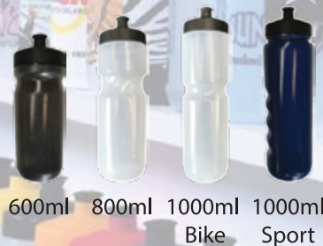
600ml 800ml 1000ml 1000ml Bike Sport

Alle EuBottle Trinkflaschen, Verschlüsse und Mundstücke werden aus recyclebarem lebensmitteltauglichem Kunststoff ( LDPE ) hergestellt und unterliegen eigenen Trinkflaschentests.